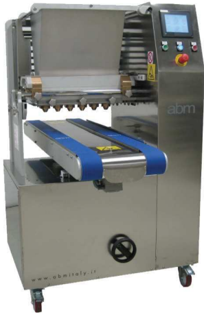
MADE IN ITALY

Beispiele von Produkte mit Standard Zubehörteile Product examples with standard accessories