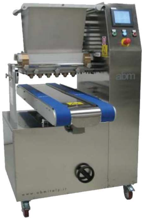
MADE IN ITALY